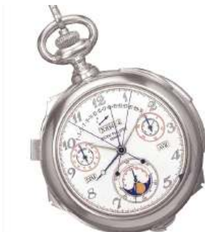
Caliber 89 «Patek Philippe» ( , 1989 )

« -89», 1989 . « » 150- 1980 . 1989 . - 4-